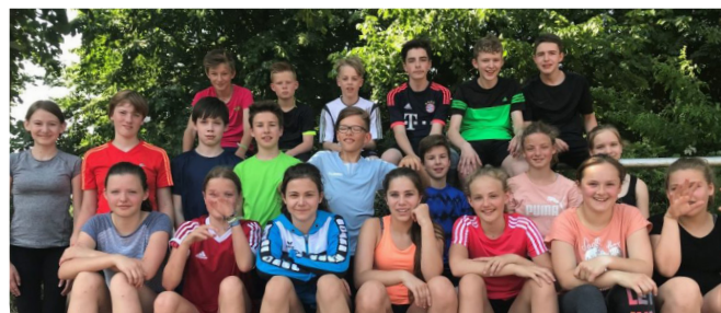
Unsere Leichtathleten aus den Klassen 6 und 7

sogar ganz nach vorne. Gratuliere! Aber auch wenn man nicht auf den ersten Plätzen landete, haben schlussendlich doch alle gewonnen, das war jedem klar, der die Schülerinnen und Schüler