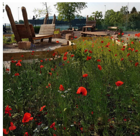
Mohn im neu gestalteten Bereich unseres Schulhofs

In den letzten Monaten hat sich bei uns wieder einiges ereignet: Wettkämpfe, unser kleines Jubiläum, Konzerte und Theateraufführungen, unser Kennenlerntag, die Abiturfeier, Wandertage und Kursfahrten, unsere dritte Mitmachaktion... Nehmen Sie doch heute mit mir einen kleinen Einblick in unser lebendiges Schulleben.