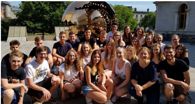
Strahlende Fahrtteilnehmer bei strahlendem Wetter in Dublin

Exkursion im Fach Geschichte erkundeten sie unter fachkundiger Führung die Altstadt und begegneten dort der Sage vom Rattenfänger von Hameln. Die Tatsache, dass bis heute historisch nicht genau belegt und begründet werden konnte, aus welchen Gründen im Jahre 1284 fast 130 Kinder aus der Stadt herauszogen und verschwanden, hinterließ durchaus Eindruck bei der jungen Besuchergruppe.