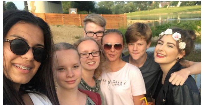
Italienische und deutsche Freunde