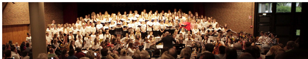
„We are family“ sangen und spielten die Mitwirkenden der Sommerkonzerte

Dieses Bild werden sicherlich auch die Ehrengäste mitnehmen, die vor dem Konzert an einer kleinen Feierstunde anlässlich des 40. Jubiläums unserer Schule teilgenommen haben.