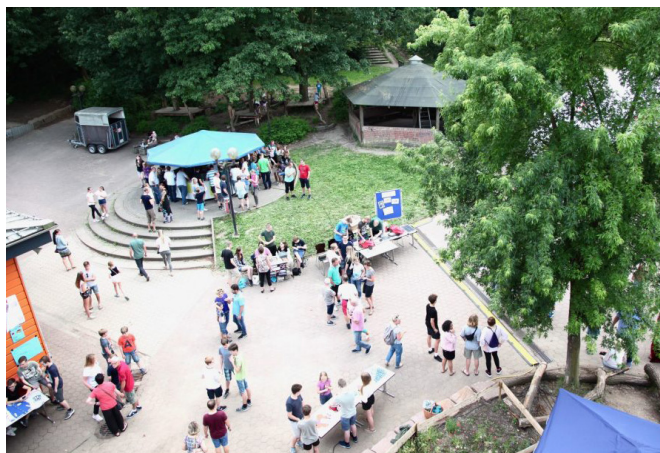
Es gab viel zu erleben beim Sommerfest

beobachtete. Der Teamgeist, der Kampfgeist und die vielen guten Leistungen, die gegenseitige Motivation und der Trost, der gespendet wurde, ließ alle glücklich und stolz nach Hause fahren.