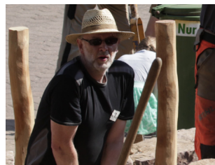
Mitmachaktion – auf in den Seilgarten!