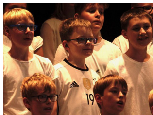
Eine ganz große „Familie“ im Sommerkonzert